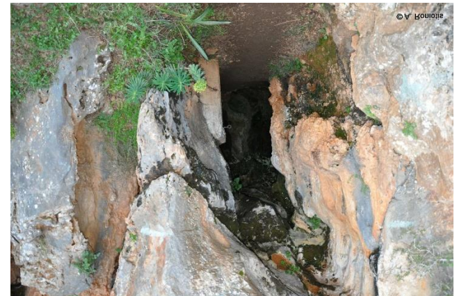
La grotte de la Banque : entrée

Des traces d'occupation de l'ère néolithique ont été découvertes dans la grotte. Initialement, la grotte était utilisée comme lieu de résidence. Plus tard, lorsque la colline de Kastelos à l'extrémité est de Tzermiado fut habitée, la Grotte de Cronos fut utilisée comme lieu de sépulture et de culte. Dans la grotte, des feuilles d'or, une figurine en faïence et une en ivoire ont été découvertes qui témoignent de l'ancienne relation entre la Crète et l'Égypte.