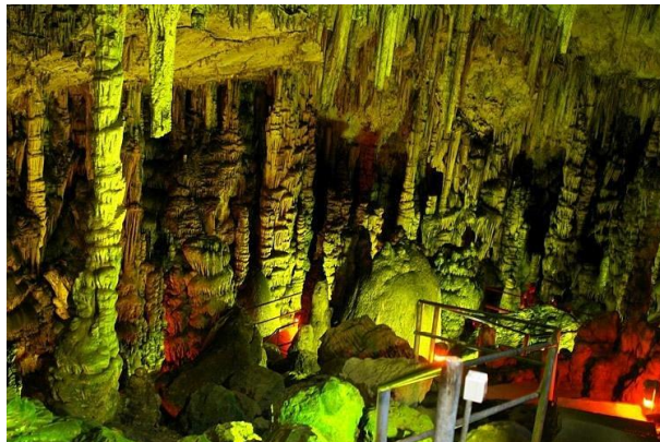
La grotte de Dictéon Andron

Située sur le versant nord du mont Dicté en Crète, au-dessus du village de Psychro sur le plateau de Lassithi, cette grotte revêt une importance considérable sur le plan mythologique et archéologique. Avec une superficie de 2200 mètres carrés, elle est ouverte aux visiteurs, offrant une expérience unique. Le parcours touristique s'étend sur une longueur totale de 250 mètres, permettant aux visiteurs de découvrir les mystères et les légendes de ce lieu fascinant.