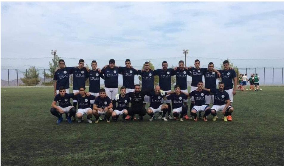
L'équipe de football du plateau de Lassithi

Bien sûr, tout n'a pas été facile. L'absence de terrain sur tout le plateau (!) et les conditions météorologiques difficiles pendant l'hiver, avec la neige atteignant deux mètres, n'ont pas permis aux joueurs du Zeus de s'entraîner. En fait, il y avait des périodes où le Zeus n'entraînait même pas pendant 20 jours d'affilée alors que la neige recouvrait tout le plateau.