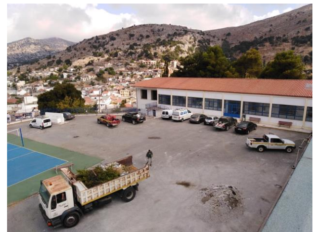
Préparations pour l'entrée

L'équipe rédactionnelle du journal était composée des élèves de la classe de seconde du lycée général de Tzermiado dans le cadre de leur évaluation en cours de français. Étant donné que le niveau des élèves dans cette matière était particulièrement bas, en raison d'un manque de couverture adéquate par les gouvernements en termes d'enseignants de français, Artemios Dalampiras, professeur de français, a jugé nécessaire de mettre en œuvre un projet qui serait proche des intérêts des élèves dans le but de les motiver et de susciter leur intérêt. Ci-dessus se trouvent les informations biographiques des élèves, avec une touche d'humour.